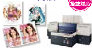
本紙校正用インクジェットプリンター Proof Jet F1100AQ