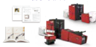
A2ワイド対応 ロールタイプ デジタル印刷機 XEIKON 9800 / 9600