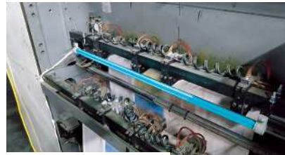
オフ輪 シーター部